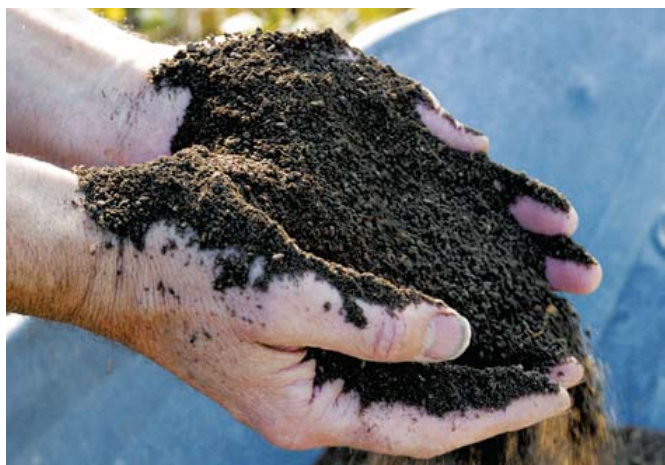
Le compost mûr se caractérise par sa couleur foncée et sa structure grumeleuse.

Il favorise la croissance des plantes et leur développement racinaire.