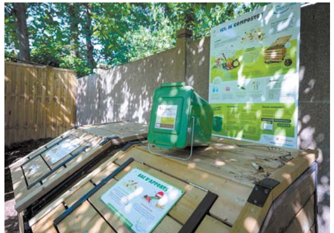
La pratique du compostage collectif, notamment en ville, est en plein développement.

Le compostage partagé peut se réaliser à l'échelle d'une résidence (en pied d'immeuble) ou d'un quartier.