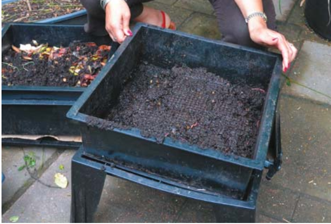
La plupart des lombricomposteurs comprennent plusieurs plateaux de travail.