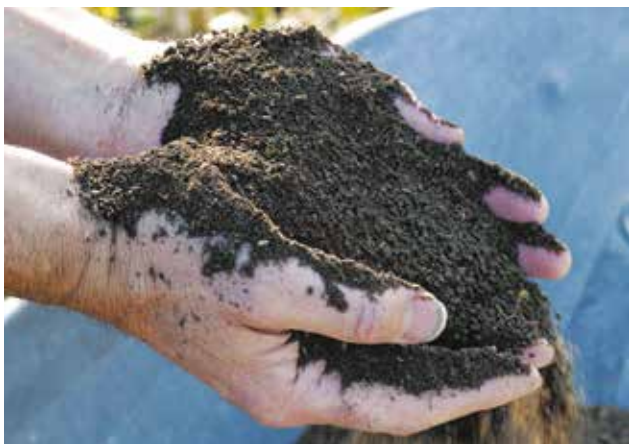
Le compost mûr se caractérise par sa couleur foncée et sa structure grumeleuse.

Il favorise la croissance des plantes et leur développement racinaire.