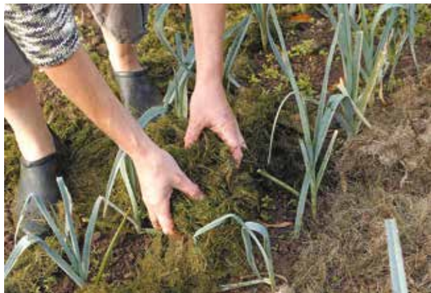
Pour pailler, on peut utiliser des tontes de pelouse, des feuilles mortes, des brindilles ou des déchets végétaux de cuisine.