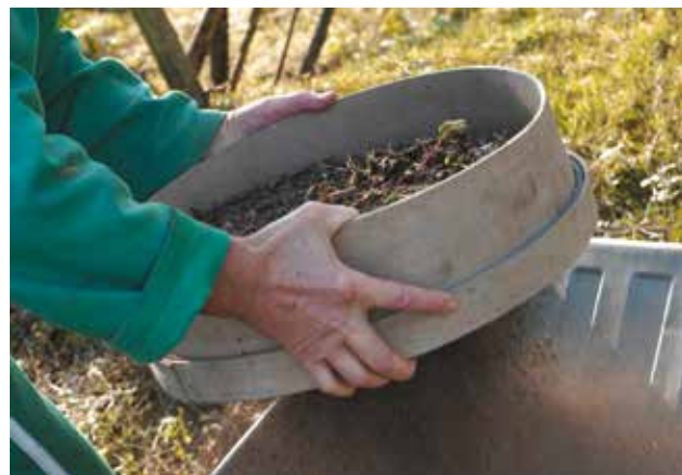
Un tamisage peut être utile pour éliminer les éléments grossiers et utiliser le compost plus facilement.

Avant maturité, le compost peut être utilisé en paillage (voir page 18) sur la terre, au pied des arbres ou sur des cultures déjà avancées. Mais il faudra attendre plusieurs semaines voire plusieurs mois avant de l'incorporer au sol car, immature, un compost peut nuire aux jeunes plants. Pour tester sa maturité, semez des graines de cresson dans des petits pots remplis de compost. Elles ne germeront que si le compost est mûr !